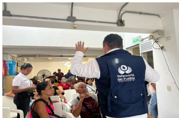
Figura 2. Taller de formación dirigido a Población Migrante, Regional Sur de Bolívar.